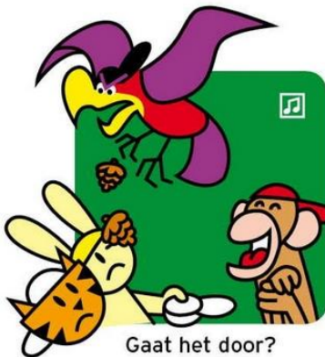
Gaat het door?