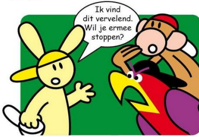
Konijn zegt wat hij naar vindt.