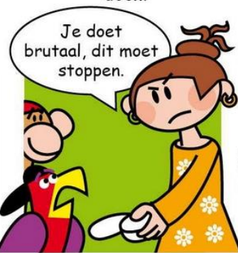
Vlerkje wil niet dat juf boos wordt en konijn bang.