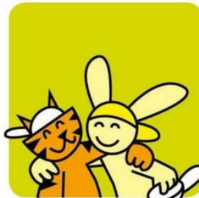
Konijn en tijger zijn maatjes.