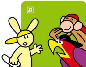
Konijn zegt wat naar is.

Vuistregel 2. Geef geen benzine aan vervelend gedrag. Als jouw vriend (of vriendin) vervelend doet, dan doe je niet mee. Je trekt bijvoorbeeld jouw vriend uit een ruzie weg. Of je zegt: "Nu moet je stoppen met roddelen. Met dit geklets los je niets op."