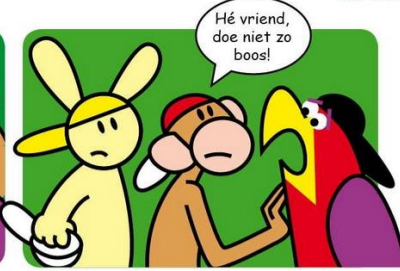
Aapje helpt konijn.