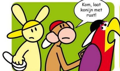
Vlerkje luistert naar zijn goede vriend.

Een echte vriend probeert je te stoppen als je rare dingen doet.