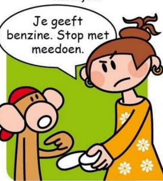
Aapje wil een goede vriend zijn en leuk meedoen.

Vuistregel 3. Blijft jouw klasgenoot vervelend doen, dan stap je naar jouw maatje. Je laat jouw klasgenoot kletsen. Jouw maatje helpt je rustig te blijven. En zegt bijvoorbeeld: "Kom we gaan iets anders doen." Of: "Laat je niet op de kast jagen. Laat ze gaan!"