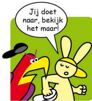
Konijn gaat iets anders doen.